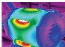
Detecteaza incalzirea neregulata a motorului