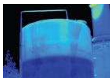
Monitorizeaza nivelul recipientului