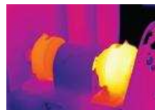
Detecteaza supraincalzirea protectiilor mecanice