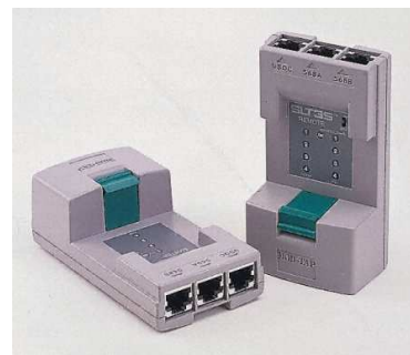
Tip Nr. stoc Tip ecranat II 215-6391